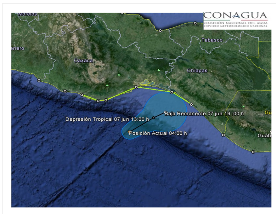
Traectoria pronóstico de la Depresión Tropical 1-E